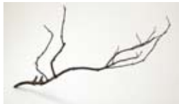
Épater le Bourgeois!, 2014 Bronze, stuffed animal 190 x 105 x 42 cm