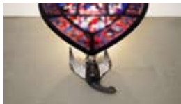
La Source, 2014 Color print (Duratrans), glass, stuffed animal, Light 40,5 x 187 x 165 cm