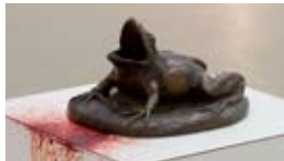
Flaubert's Frog, 2011 Bronze, pumping system, motor, paper Installation, dimension variable Edition 2