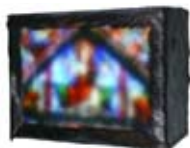
LA SOURCE, 2014 Light box, glass, color print (Duratrans), deer skin 30,5 x 41 x 18 cm Edition 12