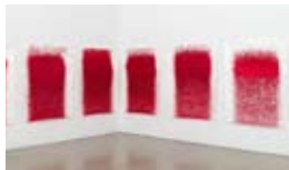
Chapeau Crapaud! (La Légende de Saint Julien l'Hospitalier), (series) 2014 each ink on canson paper each 150 x 120 cm