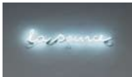
la source, 2014 Neon sign 18 x 110 x 4 cm