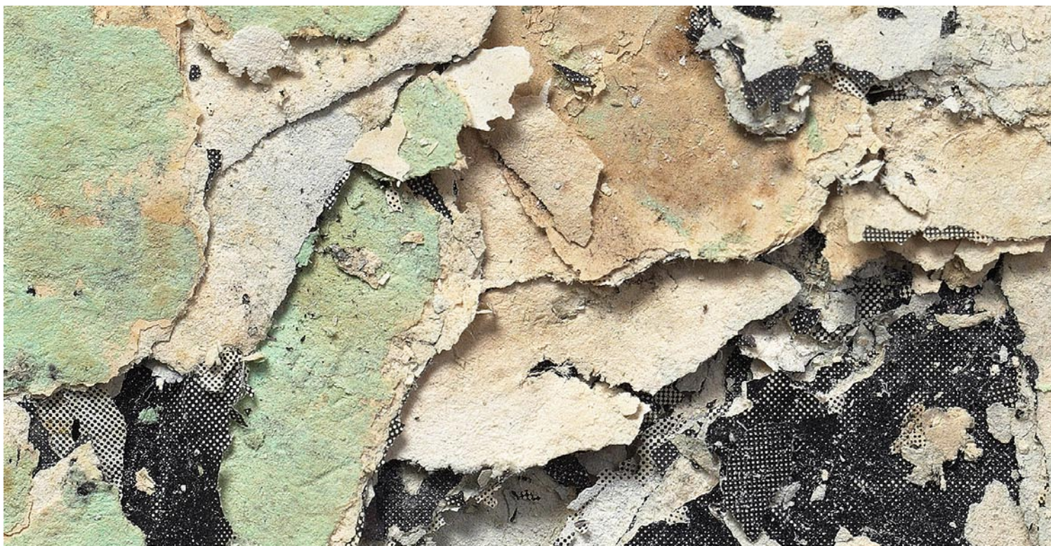
Abraham (Detail), 2009