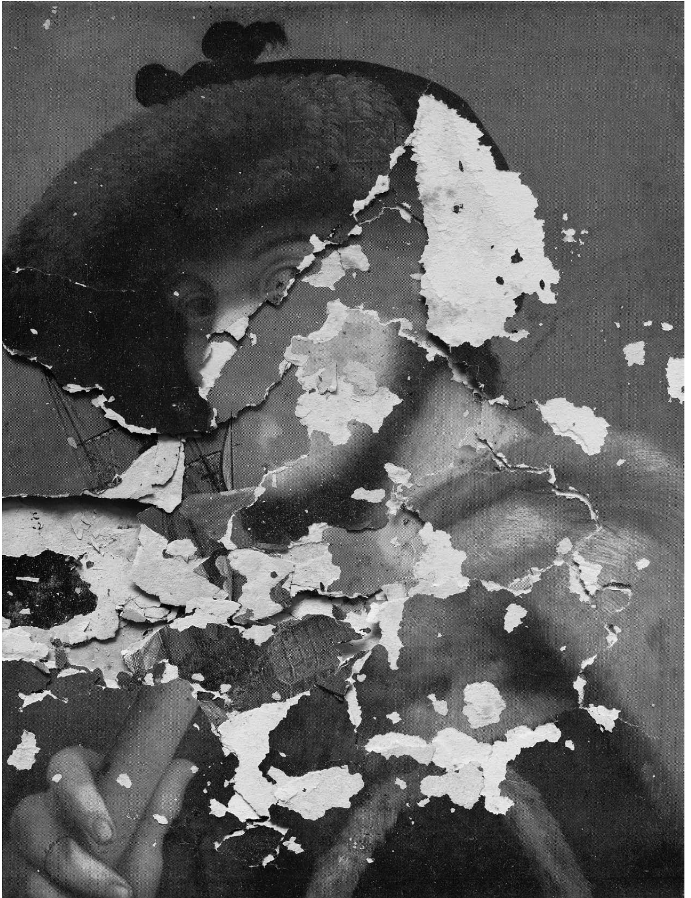
Serie: Schadenfreude , 2009 Titel: Caracci - Van de Velde Rémy Markowitsch Barytpapier, Alu, Holz, Museumsglas Grösse: (B) 120 x 91,5 cm