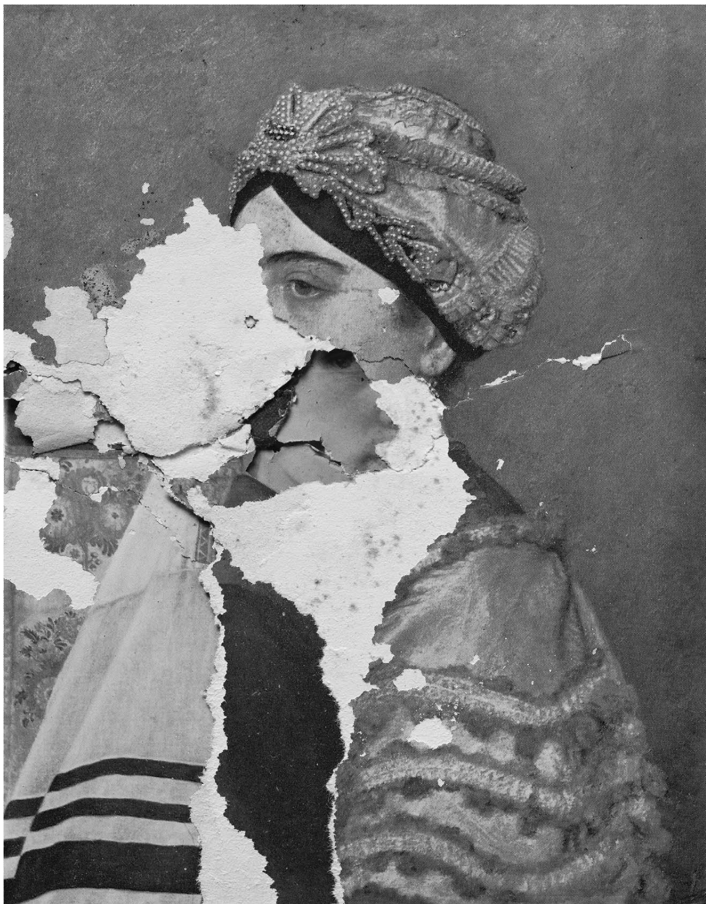
Serie: Schadenfreude , 2009 Titel: Kaufmann (jüdische Braut) Rémy Markowitsch Barytpapier, Alu, Holz, Museumsglas Grösse: (H) 120 x 93 cm