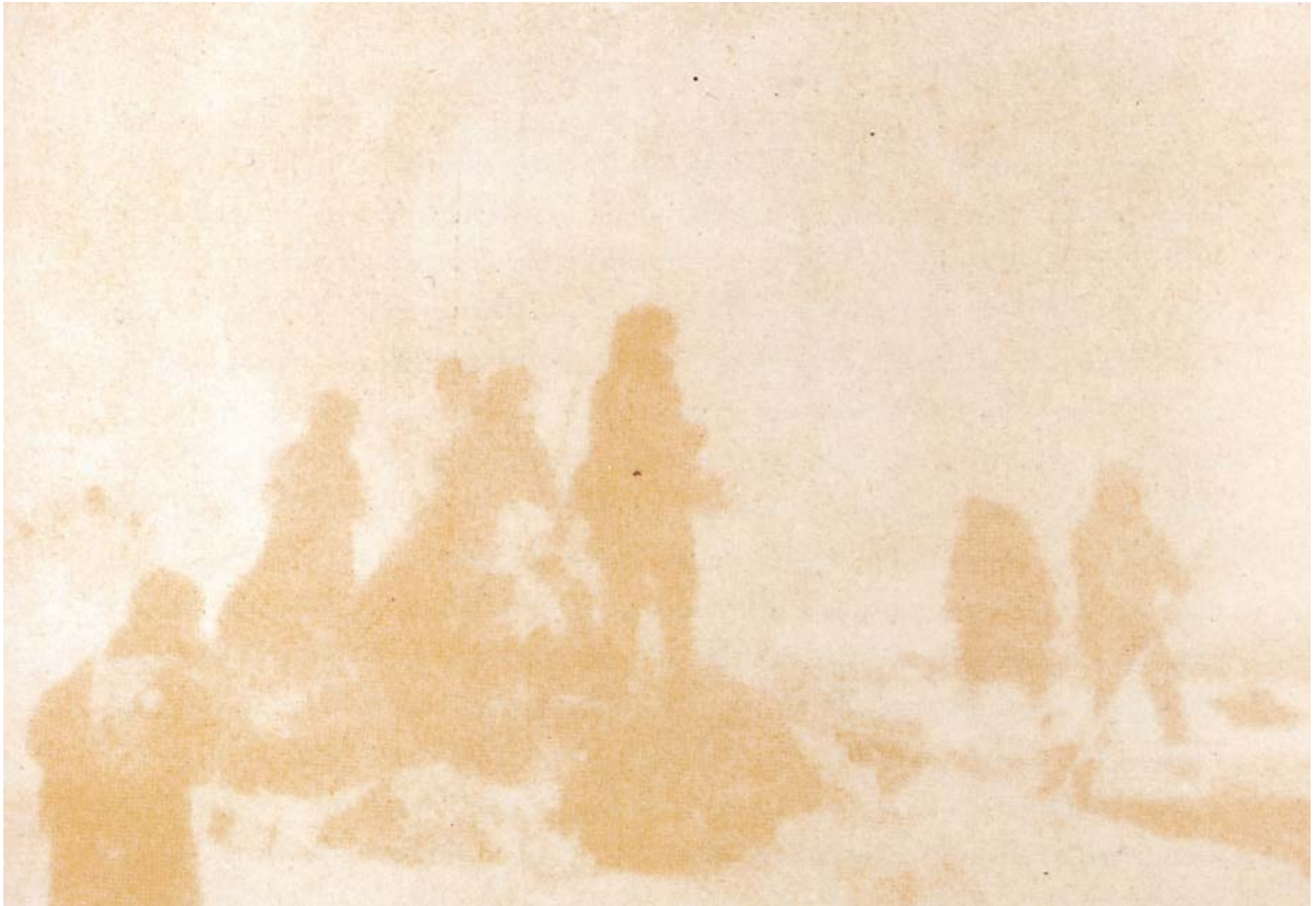
Reisegruppe , 1994 RC-Print, Aluminium, Holz, 177x251cm