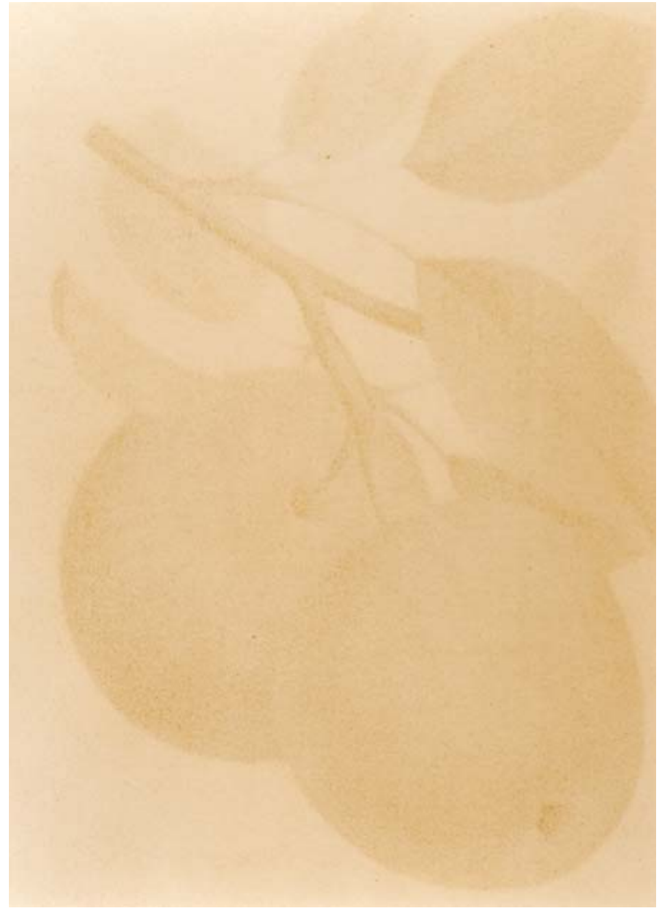
Am schönsten zu zweit, 2, 1994 RC-Print, Aluminium, Holz, 185x125 cm