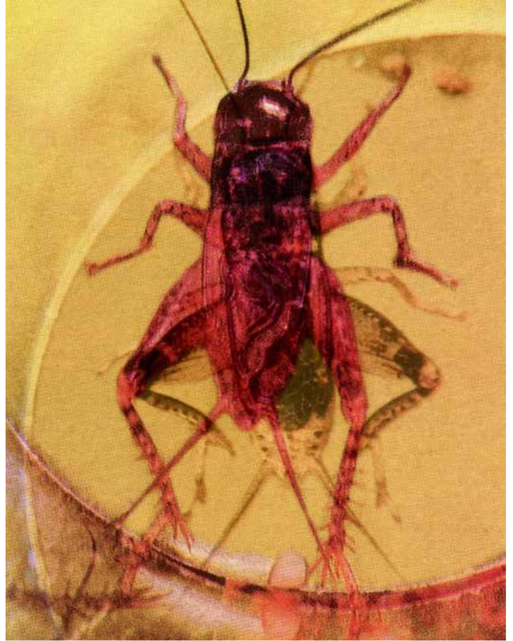
Wicked Cricket 17