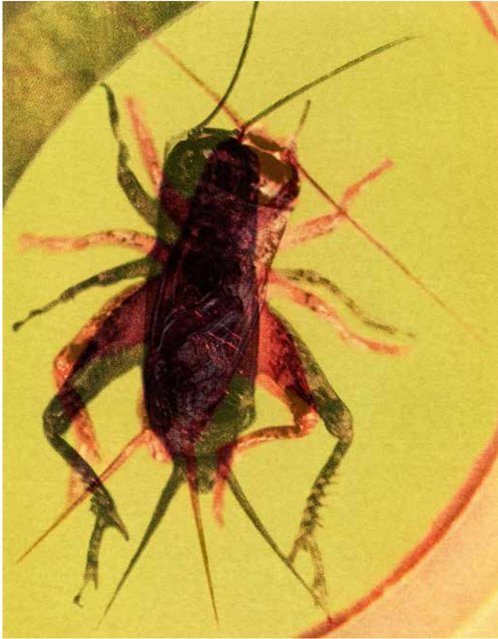
Wicked Cricket 20