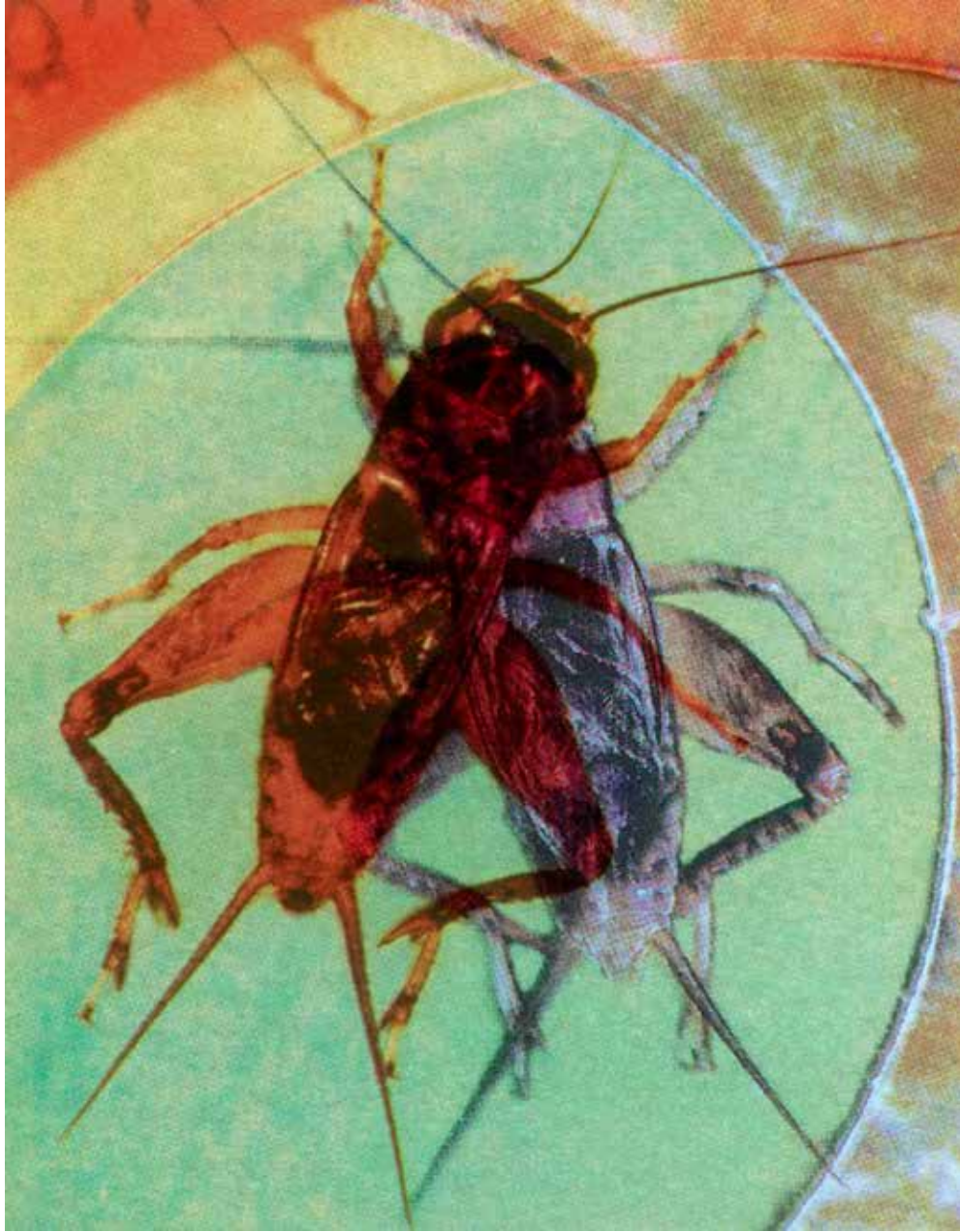
Wicked Cricket 18