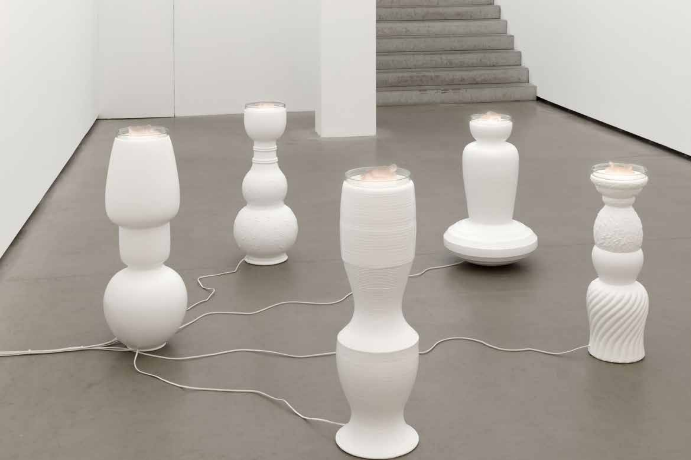
SCHWINGER ( Glückliche Zeiten / Happy Times , Galerie EIGEN +ART, Berlin, 2016)