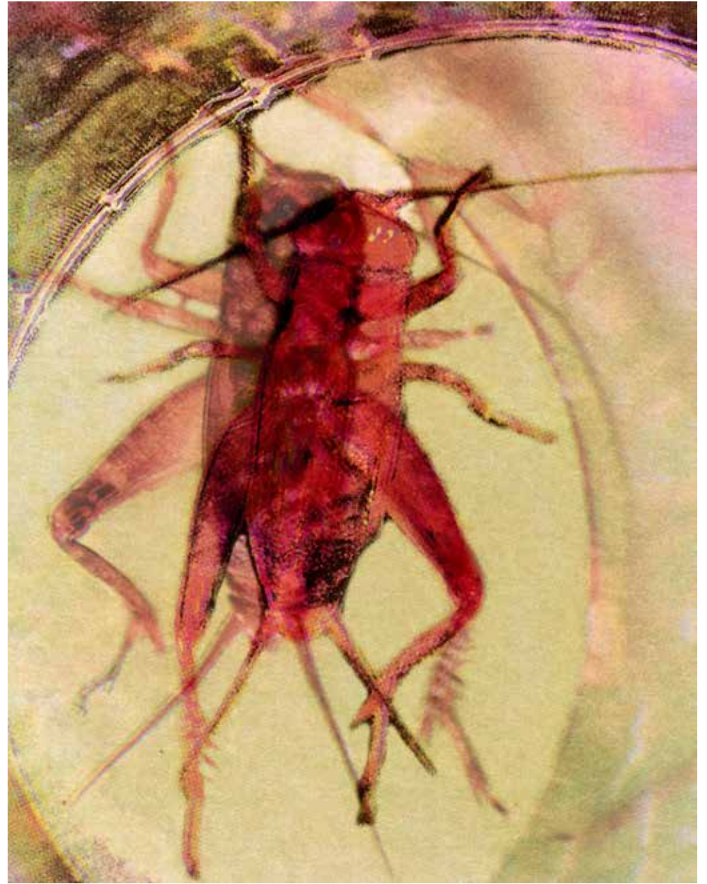
Wicked Cricket 19