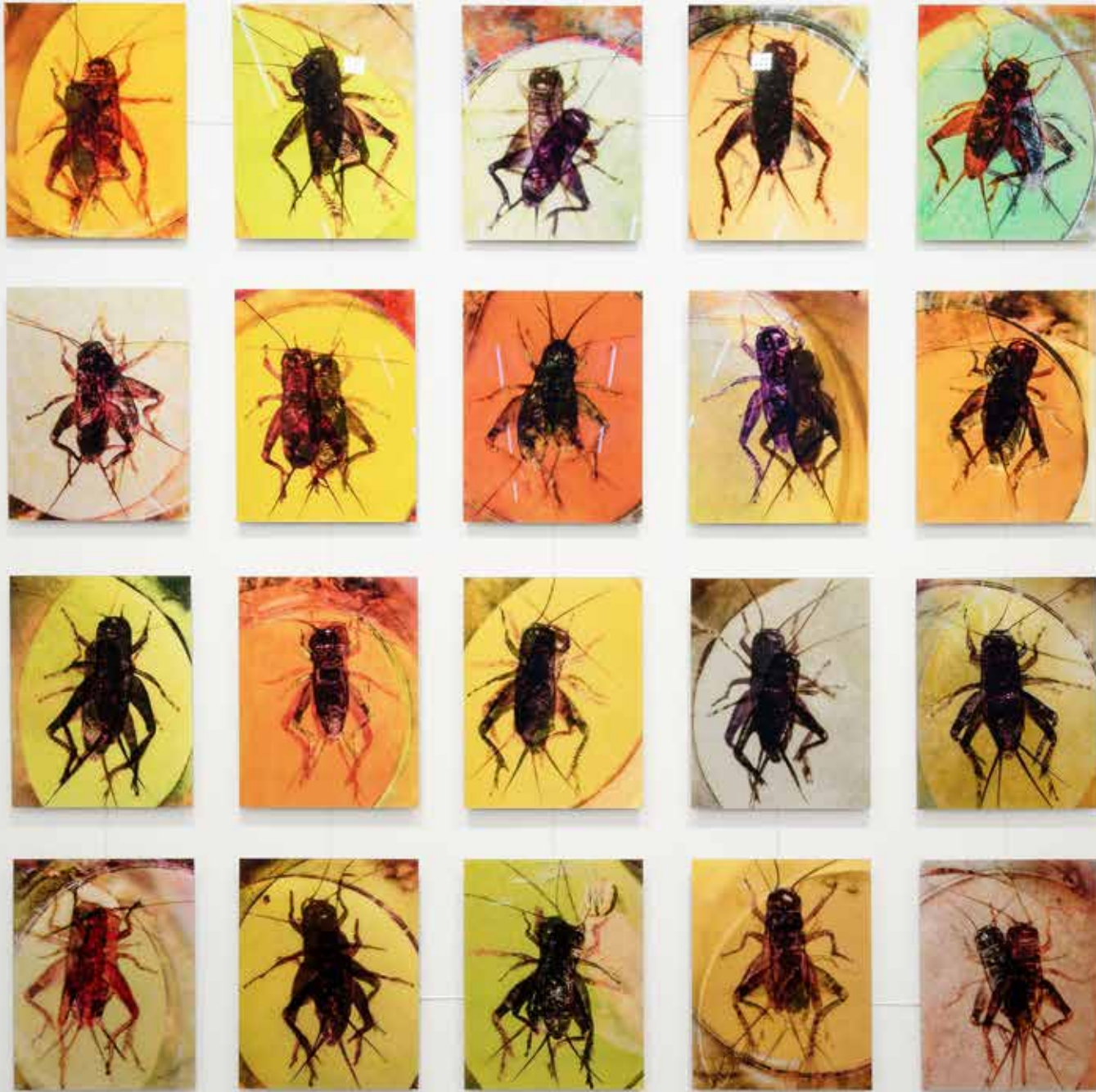
Wicked Cricket, 2016