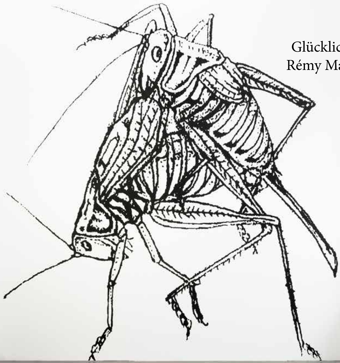
Glückliche Zeiten Rémy Markowitsch