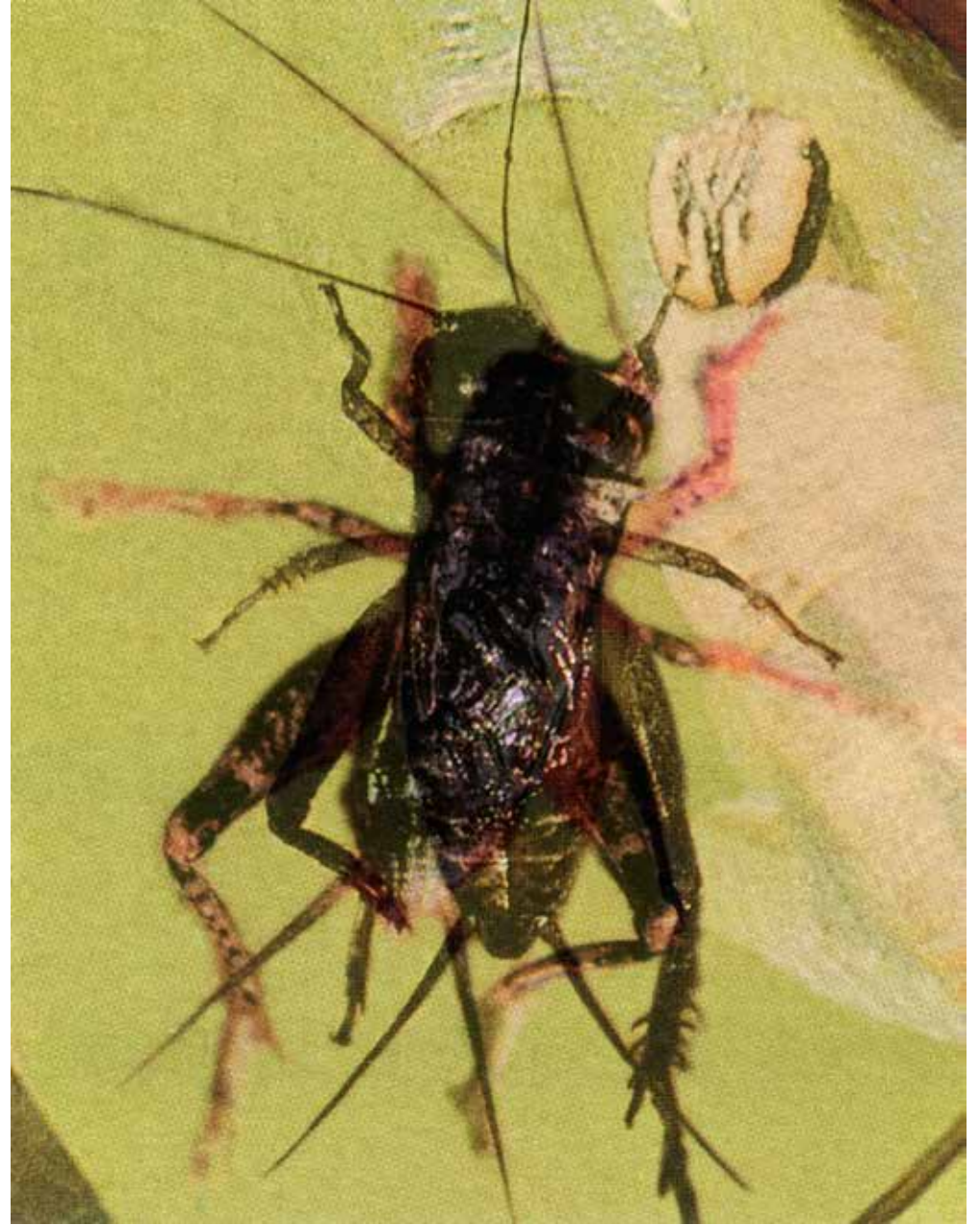
Wicked Cricket 16